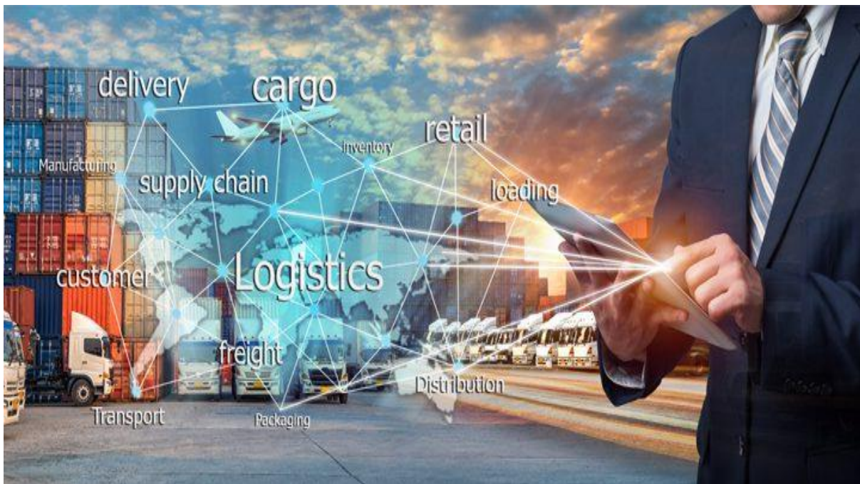
Slika 2. Koncept logistike