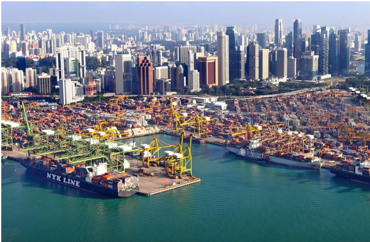
Slika 4. Pogled na kontejnerski terminal digitalne luke Singapore