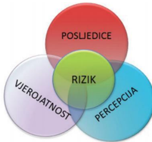
Slika 1. Prikaz značenja pojma rizika

nastanka događaja koji mogu nepovoljno utjecati na sve aktivnosti tvrtke kao i na ostvarenje njezinih ciljeva poslovanja. Prema ISO/ IEC uputama 73 rizik je “utjecaj nesigurnosti na ciljeve“. Ta nesigurnost može imati za posljedicu pozitivno ili negativno odstupanje od očekivanih rezultata. (Karić, 2006.)