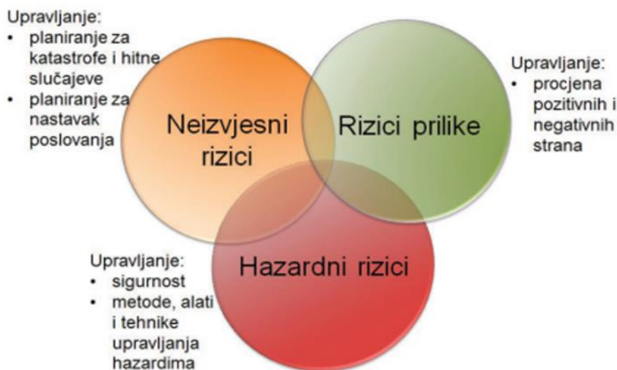
Slika 2. Osnovi tipovi rizika