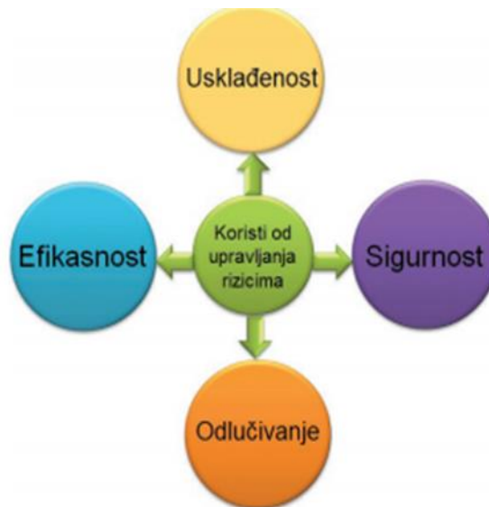
Slika 5. Korist upravljanja rizicima

u odlučivanju o povoljnim poslovnim prilikama. Konačno, ključna korist upravljanja rizicima leži u poboljšanju efikasnosti i učinkovitosti poslovanja, te je ta korist prikazana na slici 5. Kada su poslovni procesi efikasni i u skladu sa procesom upravljanja rizicima, izabrana strategija omogućava postizanje planiranog.