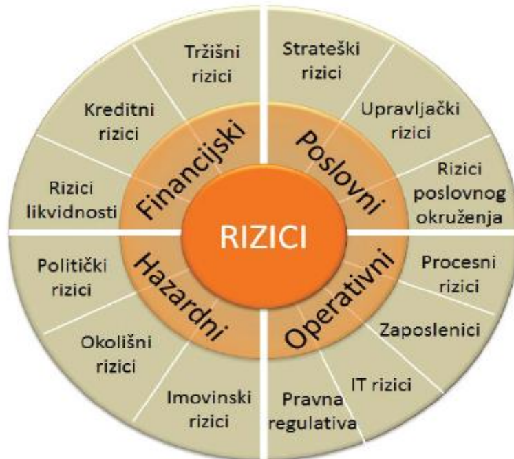
Slika 3. Vrste rizika

prouzrokovati gubitke sve dok se ne educira novi zaposlenik koji bi trebao preuzeti njegove polove), te rizik gubitka kupaca (postoje dva uzroka – ili su ih konkurenti privukli boljim proizvodima odnosno nižim cijenama ili proizvodi poduzeća više nemaju onu vrijednost za kupce pa tržište više ne postoji).