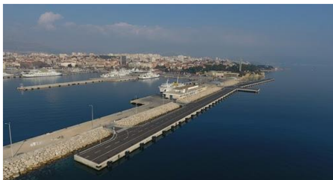
Slika 4. Vanjski lukobran u splitskoj luci

Postoje razne agencije od kojih su neke manje sa samo jednim uredom, a neke veće, s više podružnica na globalnoj razini. Radi se o agencijama koje posjeduju razna plovila, pretežito jahte, te se bave iznajmljivanjem istih, dok se neke bave prodajom ili pomoći pri prodaji jahti svom klijentu. Neke od njih, ne samo da obuhvaćaju sve prethodno navedeno u ovom poglavlju, već nude punu uslugu svojim klijentima. Takva usluga se sastoji od širokog spektra radnji, a nude pomoć odnosno asistenciju pri ulasku u teritorijalne vode neke države, te provode postupke koji se tiču carine. Također, zaposlenici takvih agencija dogovaraju sidrenje ili vez na pripadajućim mjestima kao što su razne marine, vanjski lukobrani ukoliko se radi o velikoj jahti ili pak razne priobalne šetnice. Kako bi se postigao dogovor oko veza, putem interneta se šalju sve informacije o jahti osobi zaduženoj za izdavanje vezova u pripadajućoj marini ili drugom mjestu zakonski predviđenom za vez. Primjer vanjskog lukobrana u splitskoj luci prikazan je na Slici 4 .