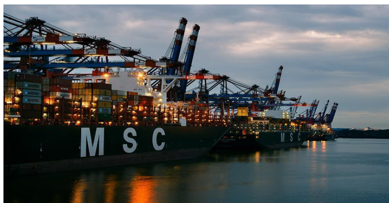
Slika 8. Primjer broda za prijevoz proizvoda u kontejnerima

Takvi procesi, osim spomenutog obuhvaćaju i zadovoljstvo kupca ili krajnjeg korisnika. Logistika se sastoji od raznih procesa kao što su: planiranje, upravljanje, kontrola prostorno-vremenske transformacije dobara, transformacije vezane za količinu, vrstu i svojstva dobara. Životni ciklus nekog proizvoda ili ciklusa također spada pod logistiku. Tijekom vremena, razni trgovinski propisi i mjere između država uvelike su smanjili troškove transporta, no i vrijeme za isti.[19]