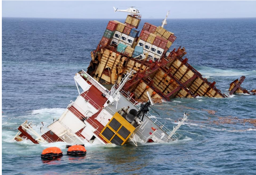
Slika 5. Havarija broda