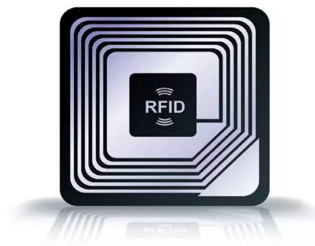
Slika 7. Primjer RFID čipa

Kako bi RFID sustav bio od koristi, na čip se stavlja neka vrsta oznake, poput serijskog broja ili koje druge informacije koja pruža identifikaciju, a kao takav je pričvršćen na antenu i tako tvori RFID Tag odnosno transponder, dok je drugi dio spomenutog sustava reader, odnosno čitač. Na ovaj način moguće je praćenje raznih dobara kod pomorskog prijevoza unutar pomorskog poslovanja.[10]