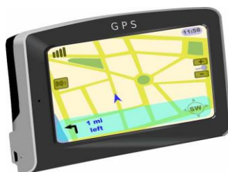
Slika 3. Ilustracija GPS uređaja

Ova tehnologija koristi se svakodnevno, od obične vožnje automobilom, preko navigacije raznih prometnih sredstava do ljudi i ostalih objekata. GPS je osnova i sinonim navigacije u suvremenom dobu. Primjer takvog uređaja na ilustriran način prikazan je na Slici 3 . Ova vrsta navigacije, kao najpoznatija, zasniva se na radionavigaciji pomoću satelita, a čiji je vlasnik vlada SAD-a. Kroz 4 ili više satelita, ova metoda određuje položaj objekta i vrijeme bilo gdje na Zemlji, no i blizu Zemlje, uz uvjet da nema blokade signala, poput velikih planina.